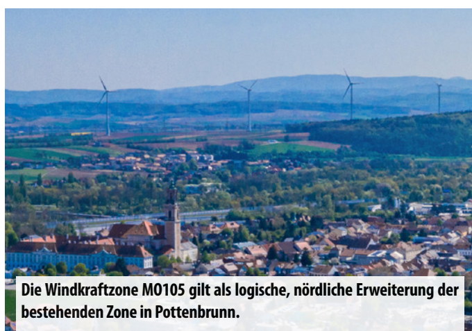
Die Windkraftzone M0105 gilt als logische, nördliche Erweiterung der bestehenden Zone in Pottenbrunn.

Eine partnerschaftliche Umsetzung bringt beiden Seiten Verlässlichkeit - auch bei möglichen Änderungen der gesetzlichen Rahmenbedingungen oder wirtschaftlichen Entwicklungen.